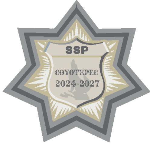
SEGURIDAD PUBLICA MUNICIPAL